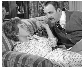
1960 UN VISON POUR MADEMOISELLE (Make Mine Mink) de Robert Asher avec B. Whitelaw