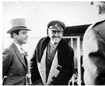
1965 YOU MUST BE JOKING ? de Michael Winner avec Michael Callan