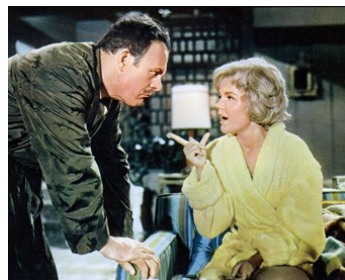
1962 APPARTEMENT POUR HOMME SEUL (Bachelor Flat) de F. Tashlin avec Tuesday Weld