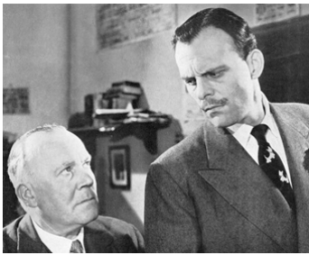
1948 DATE WITH A DREAM de Dicky Leeman avec Wally Patch