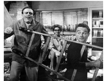
1961 HIS AND HERS de Brian Desmond Hurst avec Janet Scott, Kenneth Connor