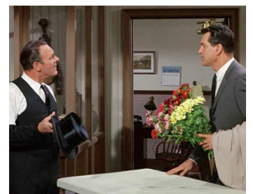
1965 ÉTRANGES COMPAGNONS DE LIT (Strange Bedfellows) de M. Frank avec Rock Hudson