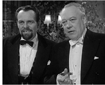
1957 SEPT JOURS DE MALHEUR (Lucky Jim) de Roy Boulting avec Clive Morton