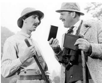
1963 LA SOURIS SUR LA LUNE (The Mouse on the Moon) de Richard Lester avec John Wood