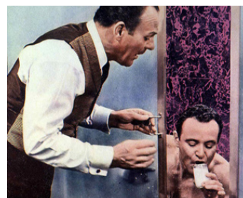
1965 COMMENT TUER VOTRE FEMME (How to murder your Wife) de R. Quine avec J. Lemmon