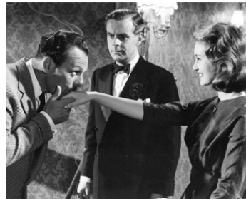
1960 L'ACADÉMIE DES COQUINS (School for Scoundrels) de R. Hamer avec Janet Scott