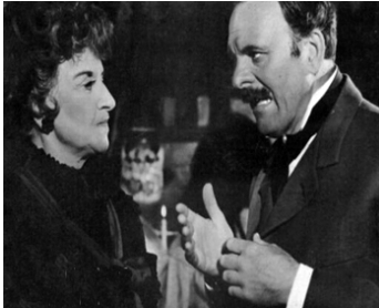
1967 LE GRAND DÉPART VERS LA LUNE (Rocket to the Moon) de Don Sharp avec H. Gingold