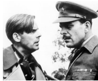
1956 CE SACRÉ Z'HÉROS (Private's Progress) de John Boulting avec Ian Carmichael