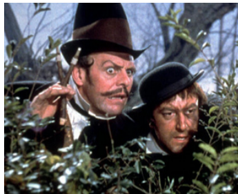
1958 LES AVENTURES DE TOM POUCE (Tom Thumb) de George Pal avec Peter Sellers