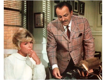
1968 QUE FAISIEZ-VOUS QUAND LES LUMIÈRES SE SONT ÉTEINTES d'H. Averbach avec D. Day