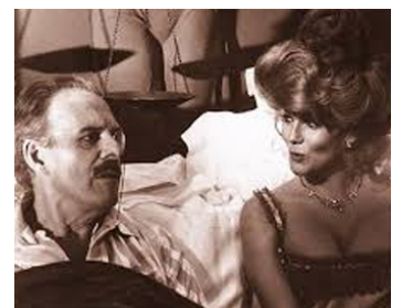
1977 MON «BEAU» LÉGIIONNAIRE (The last remake of Beau Geste) de M. Feldman avec Ann-Margret