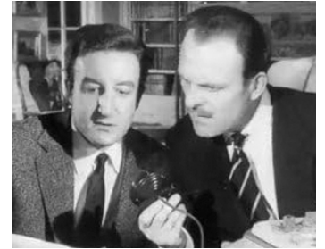
1957 LA VÉRITÉ PRESQUE NUE (The Naked Truth) de Mario Zampi avec Peter Sellers