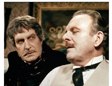
1971 L'ABOMINABLE DOCTEUR PHIBES (The Abominable Dr Phibes) de R. Fuest avec V. Price