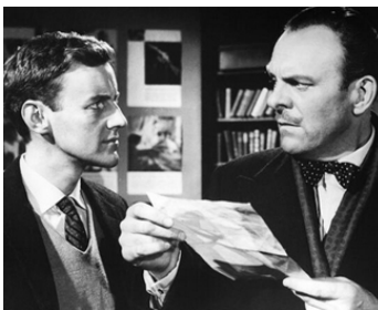
1961 UN CROQUE-MORT TROP CURIEUX (A Matter of WHO) de Don Chaffey avec Alex Nichol