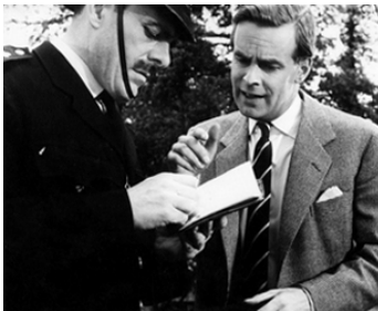
1959 GAI, GAI MARIONS-NOUS ! (Happy is the Bride) de Roy Boulting avec Ian Carmichael