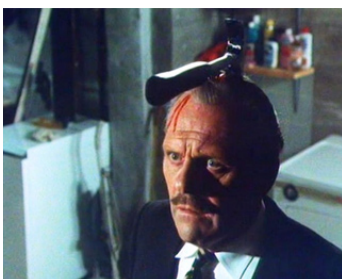
1973 LE CAVEAU DE LA TERREUR (The Vault of Horror) de Roy Ward Baker