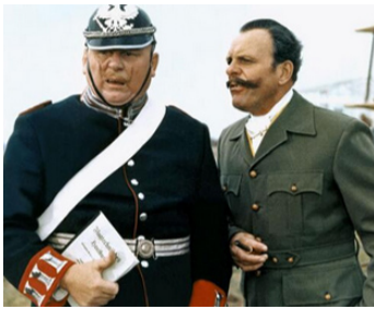
1965 CES MERVEILLEUX FOUS VOLANTS... de Ken Annakin avec Gert Froebe