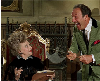
1966 FRANKENSTEIN ET LES FAUX-MONNAYEURS (Munster, Go Home) d'E. Bellamy avec H. Gingold