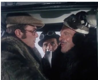
1969 GONFLÉS À BLOC (Monte Carlo or Bust) de Ken Annakin avec Tony Curtis