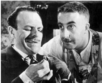
1959 APRÈS MOI LE DÉLUGE (I'm all right Jack) de Roy Boulting avec Peter Sellers