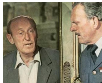
1970 LE MUR DE L'ATLANTIQUE de Marcel Camus avec Bourvil