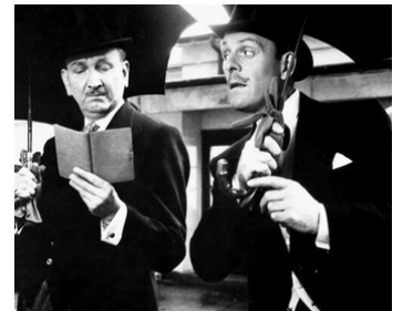
1959 SOIS TOUJOURS DIPLOMATE (Carlton Browne of the F.O.) de R. Boulting avec Raymond Huntley