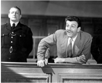
1957 CE SACRÉ CONFRÈRE (Brothers in Law) de Roy Boulting