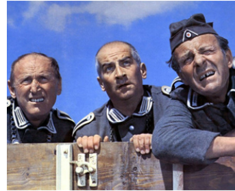
1966 LA GRANDE VADROUILLE de Gérard Oury avec Bourvil, Louis De Funès