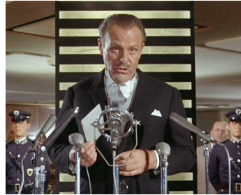
1968 DANGER DIABOLIK (Diabolik) de Mario Bava