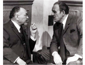
1967 TOP CRACK (Top Crack) de Mario Russo avec Edward G. Robinson