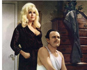
1967 PETIT GUIDE POUR MARI VOLAGE (A Guide for the Married Man) de G. Kelly avec J. Mansfield