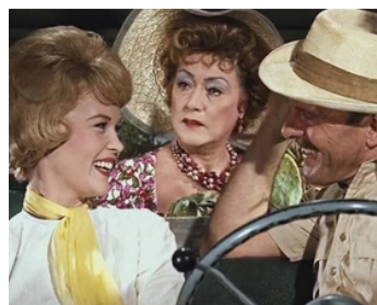
1963 UN MONDE FOU, FOU, FOU, FOU (It's a mad, mad... World) de S. Kramer avec Dorothy Provine