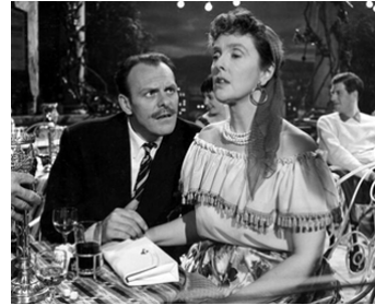
1957 FRIC-FRACS À GOGO (Blue Murder at St. Trinian's) de F. Lauder avec Joyce Grenfell