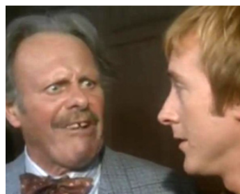
1975 SIDE BY SIDE de Bruce Beresford avec Billy Boyle