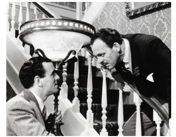
1956 UNE BOMBE PAS COMME LES AUTRES (The Green Man) de R. Day avec George Cole