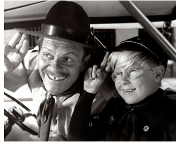
1966 L'HOMME-SANDWICH (The Sandwich Man) de Robert Hartford-Davis