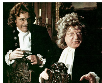
1976 THE BAWDY ADVENTURES OF TOM JONES de Cliff Owen avec Arthur Lowe