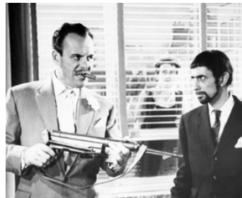
1959 NI FLEURS NI COURONNES (Too Many Crooks) de Mario Zampi avec Joe Melia