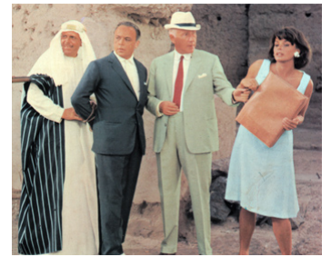
1966 OPÉRATION MARRAKECH (Our Man in Marrakesh) de D. Sharp avec H. Lom, S. Berger