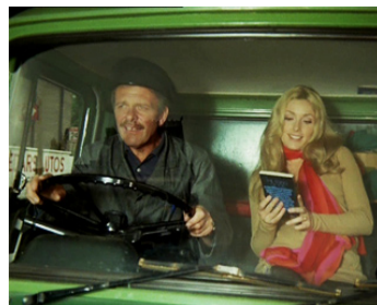
1969 12 + 1 (Una su 13) de Nicolas Gessner et Luciano Lucignani avec Sharon Tate